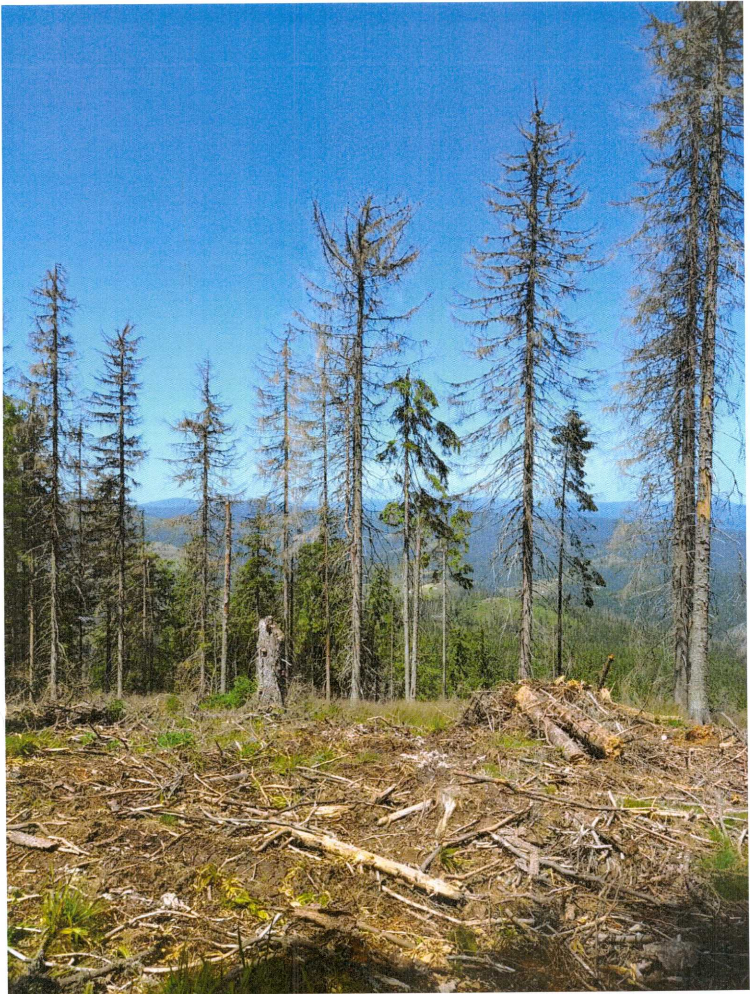
USP Pointa Head 10/10