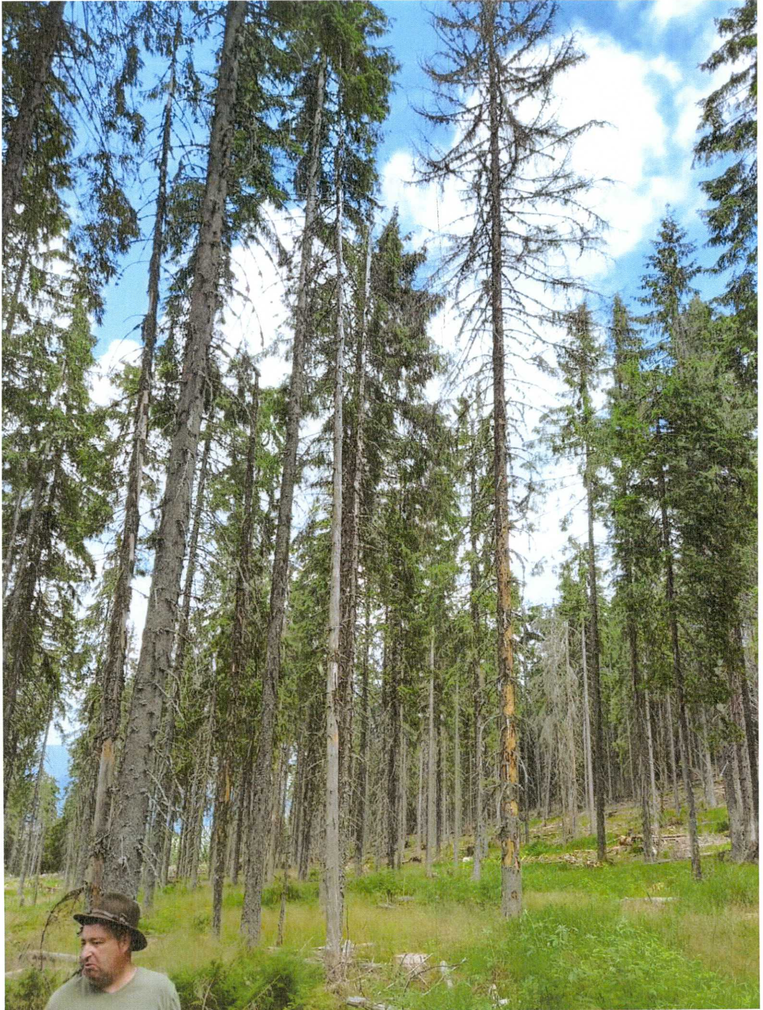
UPPER POLONE HAZEL NO. 70 C